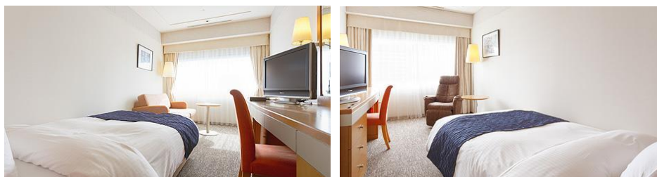
(シングルルーム例)

※喫煙・禁煙のご希望については、大会申込サイト内のお客様登録の際、喫煙・禁煙をご設定の上、お申込み下さい。尚、喫煙・禁煙のお部屋はそれぞれ数に限りがありご希望は先着順となりますので、お早目にお申込み下さいますようお願い申し上げます。